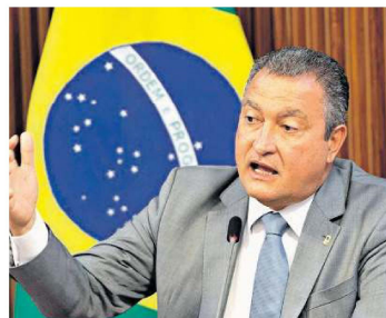
O ministro Rui Costa chegou a anunciar que o Novo PAC seria lançado em abril

O governo do presidente Luiz Inácio Lula da Silva (PT) trabalha com a expectativa de lançar em julho o chamado Novo PAC (Programa de Aceleração do Crescimento) com cerca de 2.000 obras, entre empreendimentos federais e estaduais.