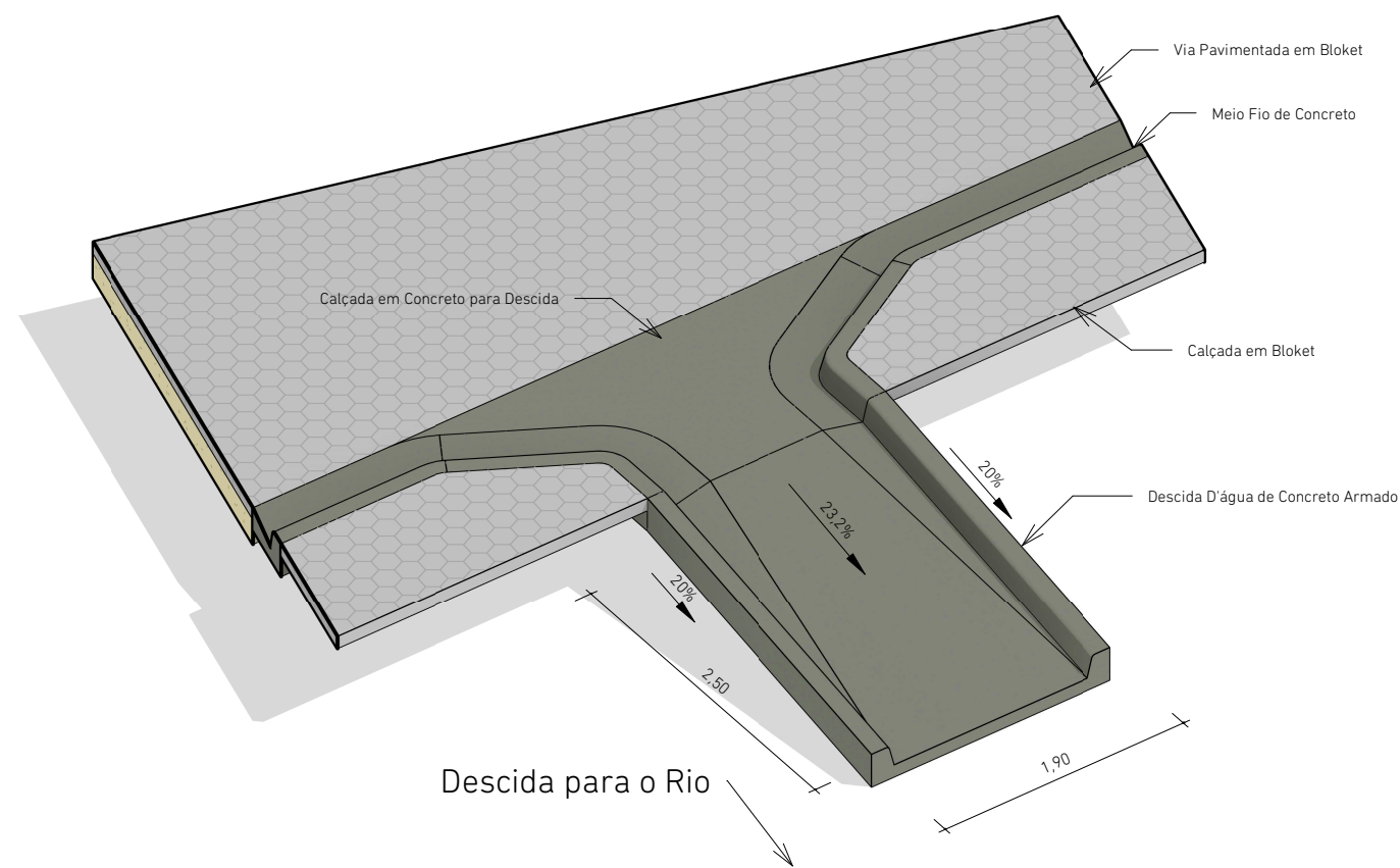
3D - Descida D'água - 1:50