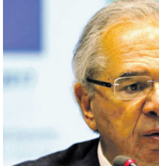
Guedes é o novo sócio da Empresa de investimentos Legend Capital