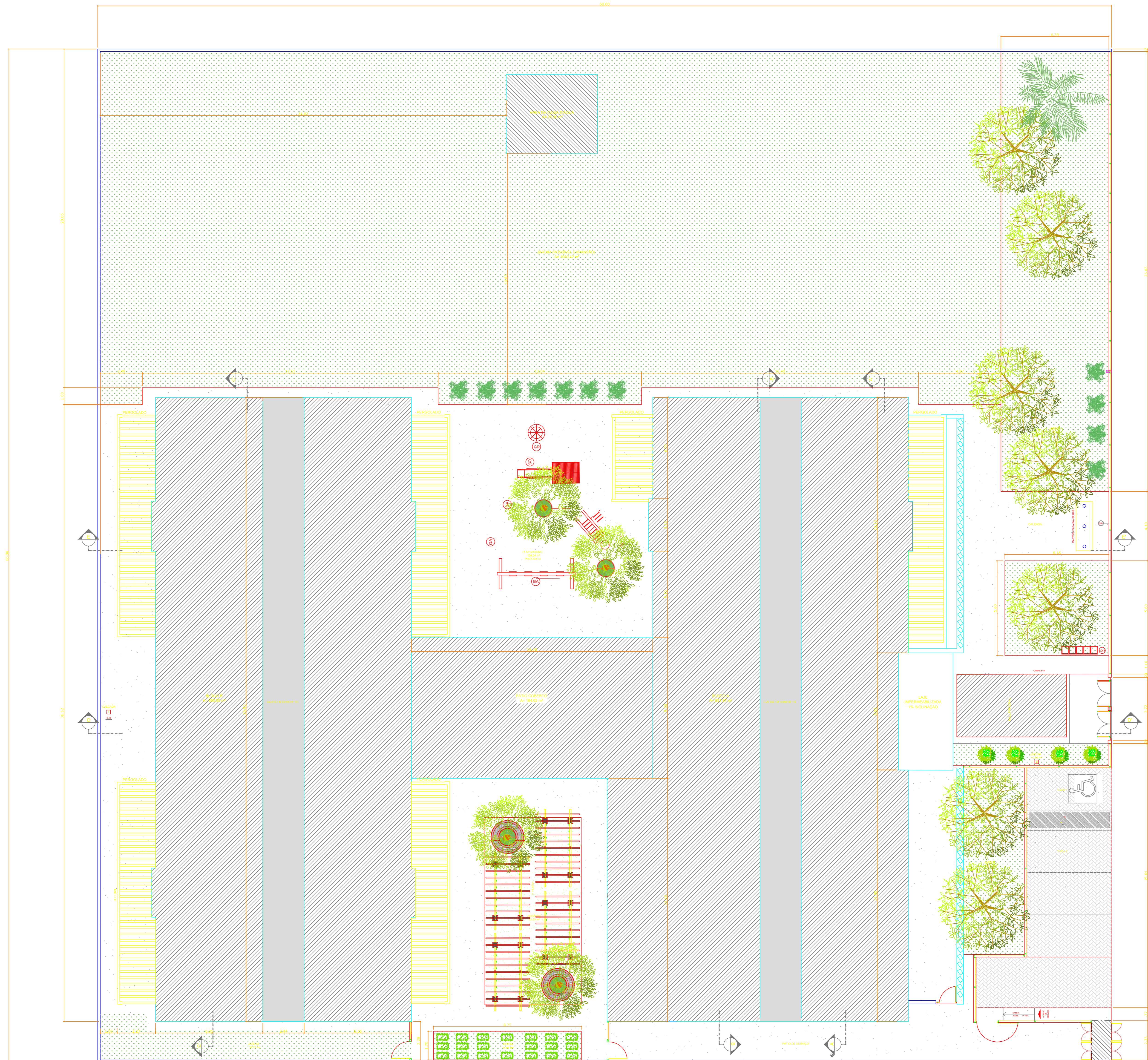
1 PLANTA DE IMPLANTAÇÃO ESCALA 1/100